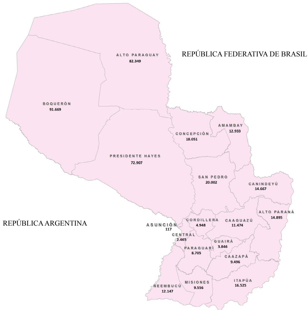
PARAGUAY Superficie por departamento (Km 2 )