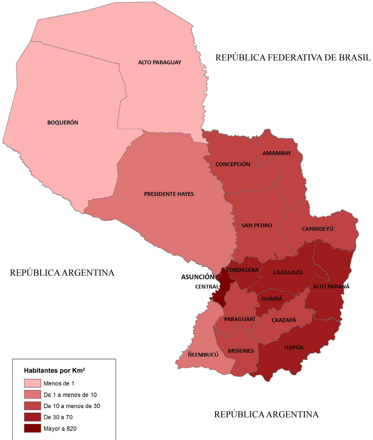
PARAGUAY Densidad de población Año 2018